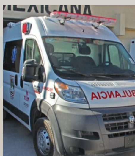
AMBULANCIA DONADA AL MUNICIPIO DE ACAPULCO DE JUÁREZ, GUERRERO.

La Doctora Honoris Causa buscó mejorar el entorno de las personas y así coadyuvar con la satisfacción de los elementos de bienestar social y como consecuencia mejorar la calidad de vida de los más desfavorecidos, considerando la salud como el pilar fundamental sobre el que se apoya el desarrollo social.