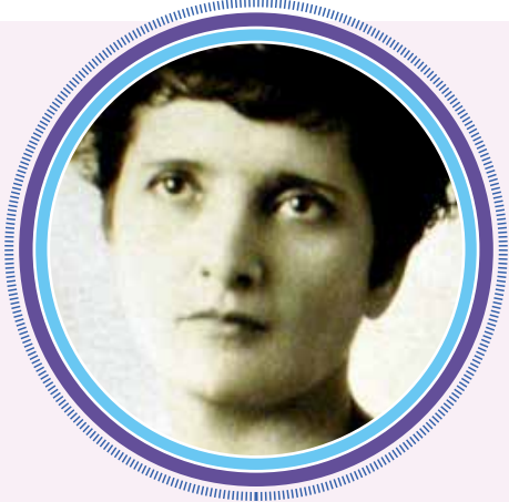
Elvia Carrillo Puerto.

Murió el 15 de abril de 1968 en la Ciudad de México, no sin antes ser reconocida como una de las más grandes luchadoras por los derechos de las mujeres en México.