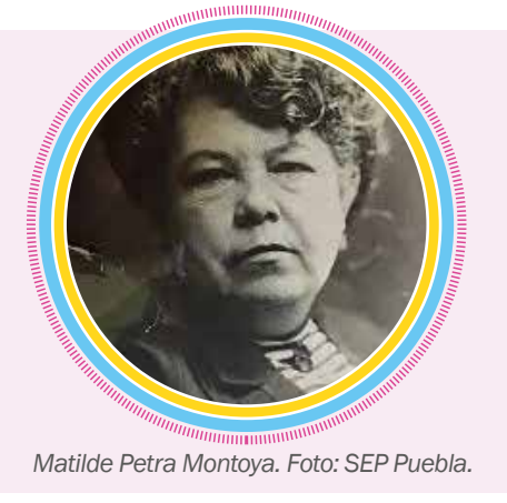
Matilde Petra Montoya.

Matilde murió el 26 de enero de 1938, después de más de medio siglo de abrir las puertas de la medicina a otras mujeres.