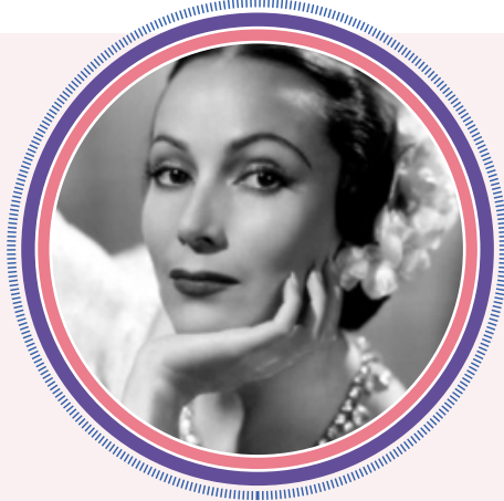
Dolores del Río

Nació el 3 de agosto de 1904 en Durango y murió el 11 de abril de 1984 en California, no sin antes convertirse en una de las actrices más reconocidas de Latinoamérica.