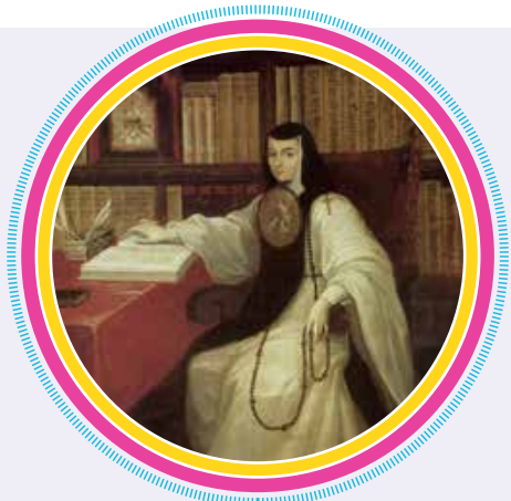
Miguel Cabrera: Retrato de Sor Juana Inés de la Cruz, 1750.

Esta vez recordamos a las 10 de las mujeres más sobresalientes que nacieron en lo que hoy se conoce como México, quienes han sido parte fundamental de la historia de la nación.