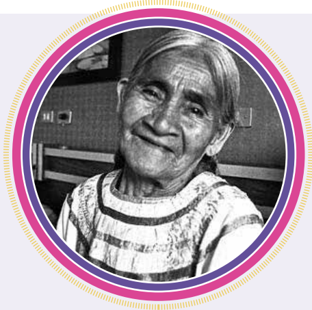
María Sabina.

A lo largo de su vida recibió la visita de diversas personalidades de la política, el arte y la música en el mundo. Murió el 23 de noviembre de 1985, dejando un legado para la posteridad.