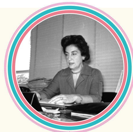
Griselda Álvarez.

Griselda fue una destacada maestra y escritora antes de incursionar en el mundo de la política. Estudió para maestra normalista y posteriormente cursó la carrera de Letras Españolas en la Facultad de Filosofía y Letras de la Universidad Nacional Autónoma de México (UNAM). Murió el 26 de marzo de 2009.